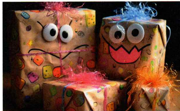
Mit Wackelaugen kannst du auch Geschenke oder Karten verzieren.