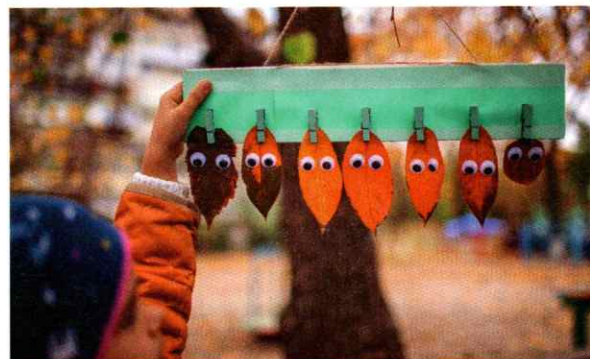
Aus einer Sammlung von bunten Herbstblättern machen Wackelaugen ein kleines Kunstwerk.