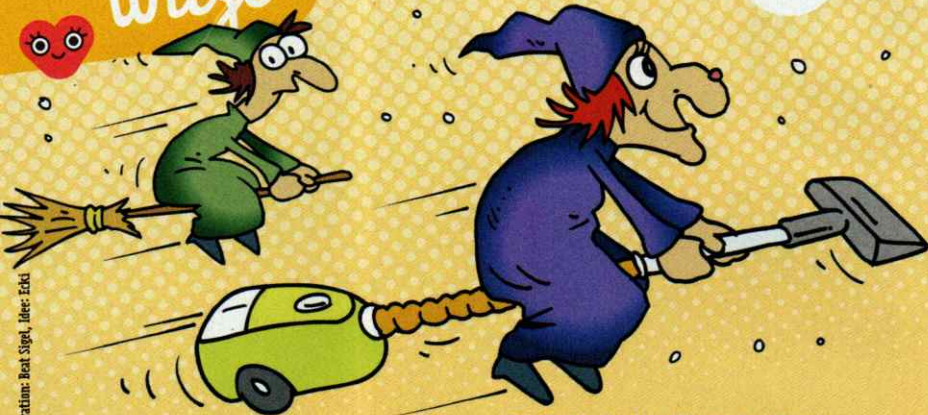
Illustration: Beat Sigt, Idee: Eckli

„Sag mal, Willi, rauchen deine Kühe und Pferde?“ – „Natürlich nicht!“ – „Dann brennt wohl dein Stall!“