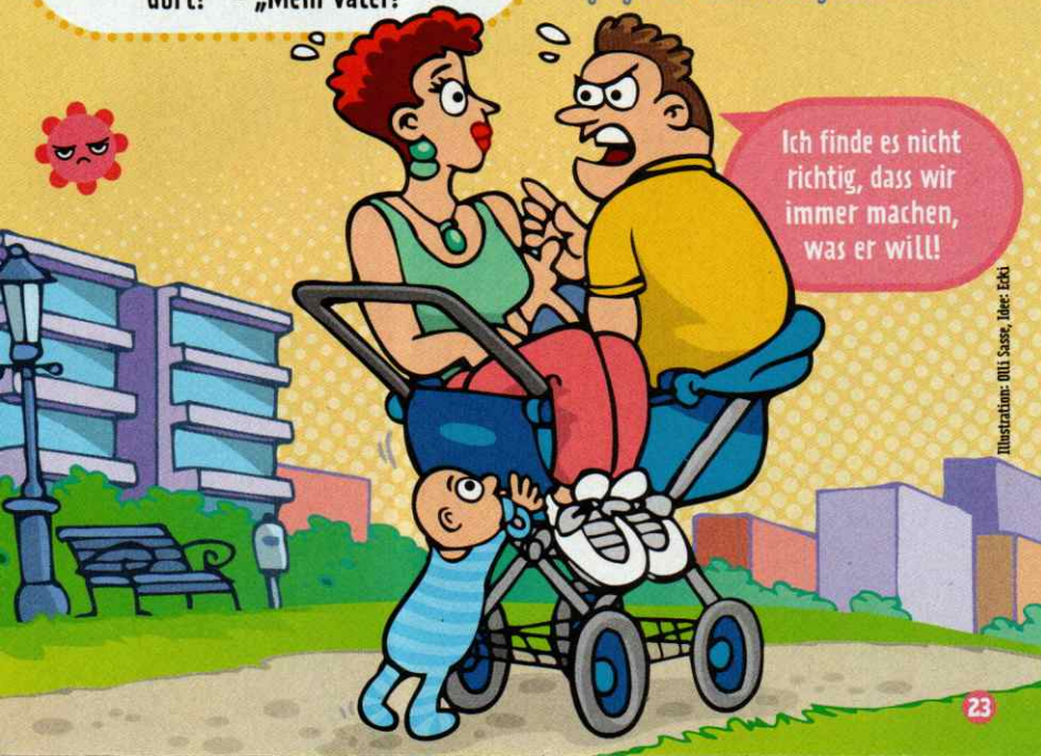
Illustration: Olli Sasse, Jacek Eki

Ich finde es nicht richtig, dass wir immer machen, was er will!