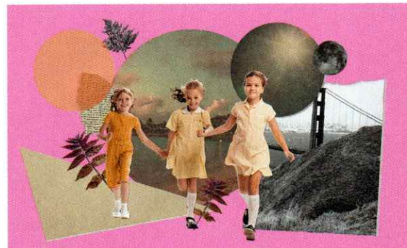
Ein Mix aus Materialien und Formen macht dein Kunstwerk zu etwas ganz Besonderem.