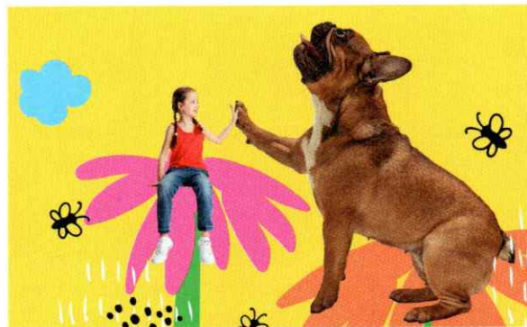
Besonders lustige Collagen entstehen aus einer Kombination von Fotos und Zeichnungen.