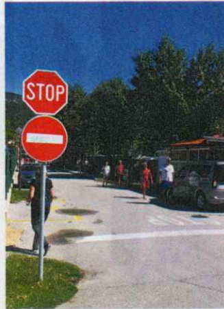
Krk (Kroatien). Vor dem widerrechtlichen Befahren in dieser Richtung ist anzuhalten.