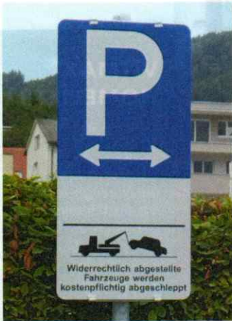
Kirchdorf a.d. Krems. Parkplatz mit Beipackzettel – aber wem droht hier die Abschleppung?