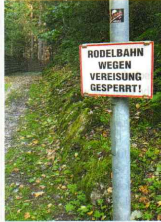
Zell am See. Dieser Schnappschuss entstand kurz nach dem Auftauen des Sommer-Eises.