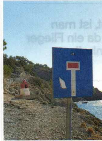
Karpathos (Griechenland). Wer bis hierher gefahren ist, sollte umkehren: Später geht's nimmer.

Senden Sie Ihre Digitalbilder per E-Mail an: autotouring.redaktion@oeamtc.at