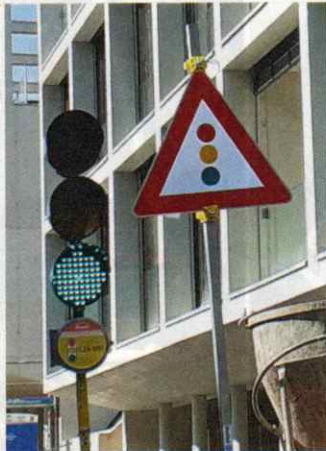
Dornbirn. Und plötzlich war die Ampel da. Gut, dass darauf aufmerksam gemacht wird!