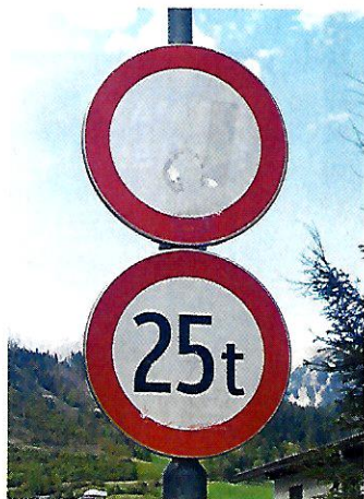
Schladming. Wer einen Lkw über 25 Tonnen lenkt, muss hier gleich mit zwei Strafen rechnen.