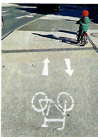
Hallein. Die Stadt an der Salzach ist nun Testgebiet. Erprobt wird der Linksverkehr für Radfahrer.