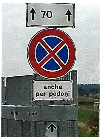
Massafra (Apulien). Hier ist auch Fußgängern (pedoni) das Halten verboten. Also rasch weglaufen!