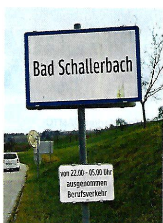
Bad Schallerbach. Untertags ist der Beginn des Ortsgebietes (und Tempo 50?) ausgesetzt.

Senden Sie Ihre Digitalbilder per E-Mail an: autotouring.redaktion@oeamtc.at