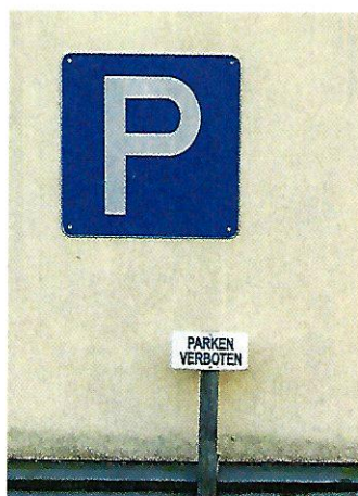
Steyr. Bitte lesen Sie vor einer Benützung dieses Parkplatzes auch das Kleingedruckte.