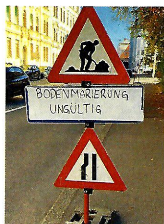
Graz. So ein Pech: Für gültige Bodenmarkierungen war keine Marie mehr da.