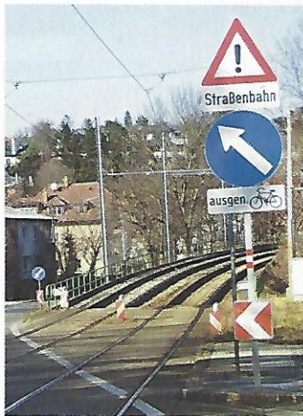
Wien. Wegen der Schwellen wird nur Mountainbikern empfohlen, auf der Trasse zu radeln.