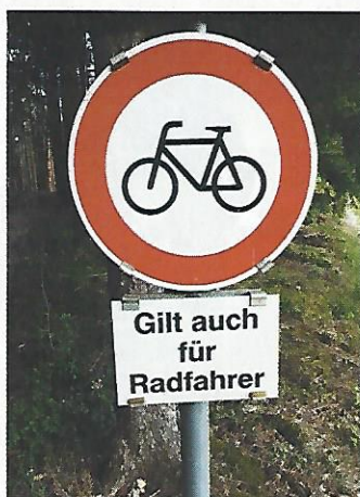
Manning. Doppelt hält besser. Oder glaubt man, Radler können keine Verkehrszeichen deuten?