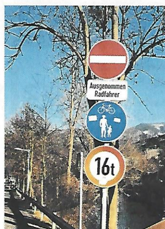
Bruck a.d. Mur. Korpulenten Radfahrern wird hier eine ganz strikte Gewichtsgrenze gesetzt.

Senden Sie Ihre Digitalbilder per E-Mail an: autotouring.redaktion@oemtc.at