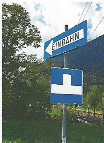
Bad Ischl. Die Verkehrsjuristen des ÖAMTC raten hier dringend vom Weiterfahren ab.