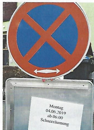
Innsbruck. Nach diesem strengen Winter braucht man bis Juni, um den Schnee wegzubringen.