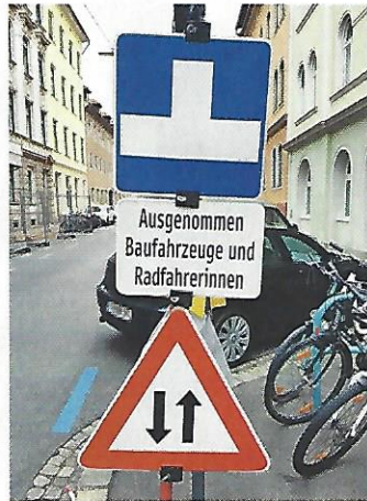
Graz. Laut Auskunft der Club-Juristen dürfen auch männliche Radfahrer weiterfahren.