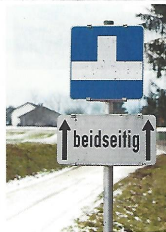
Hofkirchen. Ratlos im Traunkreis: Wie kommt man aus einseitigen Sackgassen wieder heraus?

Senden Sie Ihre Digitalbilder per E-Mail an: autotouring.redaktion@oemtc.at