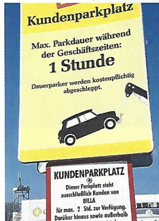
Wien. Was jetzt? Gilt nun das Kleingedruckte oder gilt es hier diesmal vielleicht nicht?