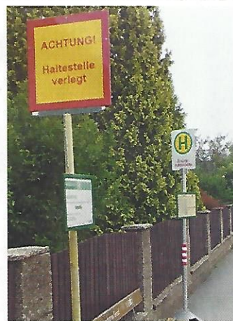
Ahrntal (Südtirol). Vorschrift ist Vorschrift: Die Haltestelle wurde ja um drei Meter verlegt.