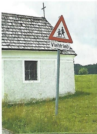
Seekirchen. Vielleicht sollten wir unser Verhältnis zu Kindern etwas überdenken.