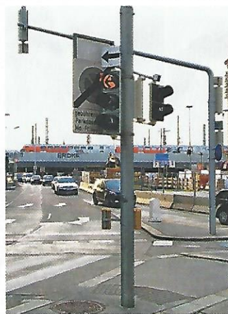
Wien. Wer die Zusatztafel lesen möchte, muss vorher die Ampel abmontieren. Viel Vergnügen!