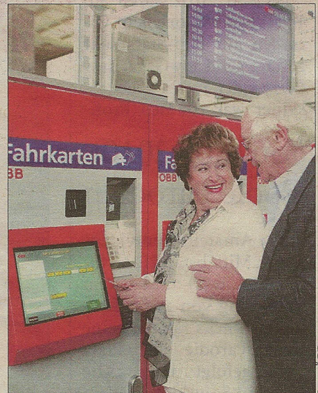
Der Ticket-Kauf am SB-Automat ist ganz einfach

Bei Fragen oder Reklamationen zu den Fahrkartenautomaten rufen Sie bitte unser Call-Center ☎ 05-1717 (österreichweit zum Ortstarif) an.